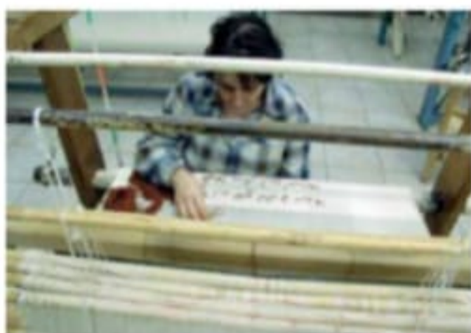
MANIFATTURA La tessitura degli arazzi in un'azienda

Un bando ad hoc Mele ripercorre le strategie messe in campo dall'amministrazione regionale per sostenere imprese e liberi professionisti invitando a maggiore attenzione verso gli artigiani: «Nei mesi scorsi la